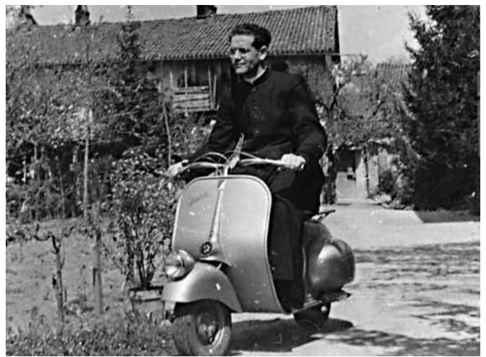
Don Giovanni in vespa.