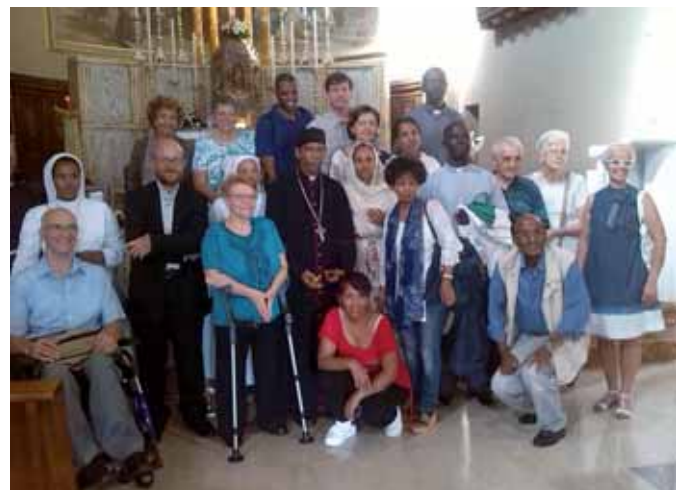
Vescovo Eritrea a Sotto il Monte.