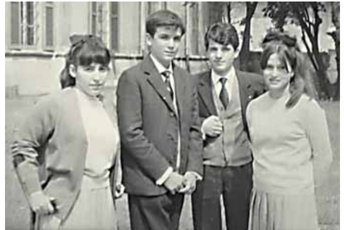
Ragazzi del Centro Pilota.