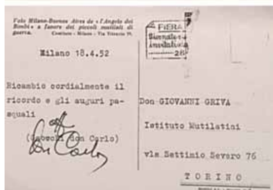
Scritto a Don Giovanni da Don Carlo.