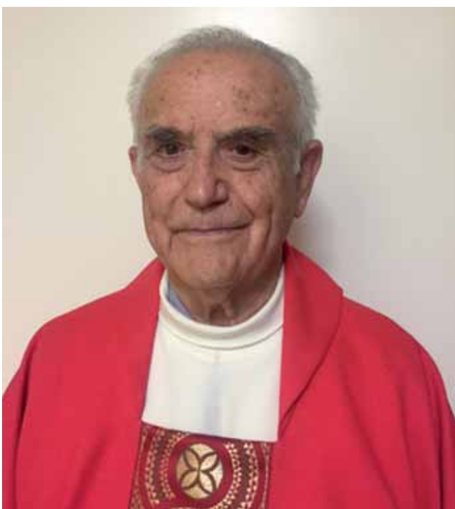
Don Giovanni ora.