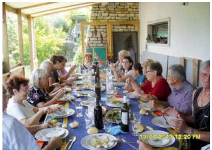
La bella tavolata