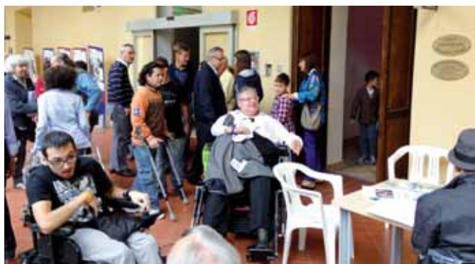
Arrivi in Collegio