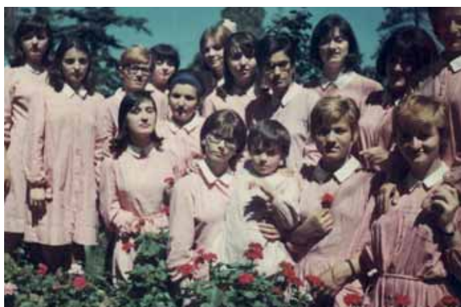
“CLASSE IV D” uscite dal collegio di Pozzolatico nel 1966 con diploma di maturità magistrale.